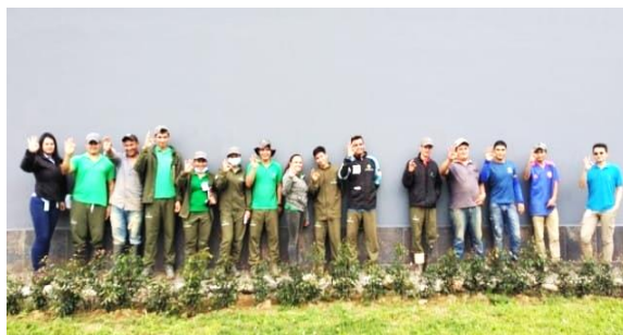
Sabia Royal Guateque

De la misma forma se mencionaron los canales de comunicación para reportar fallas en la prestación del servicio o denunciar el hurto de energía; a su vez, se dieron a conocer algunos consejos de seguridad eléctrica.