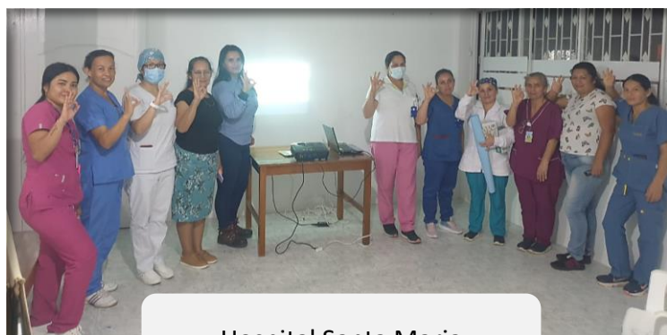
Hospital Santa Maria

Así mismo, y como tema que despertó el interés de los asistentes, se socializaron algunas buenas prácticas para utilizar la energía de forma racional y segura.